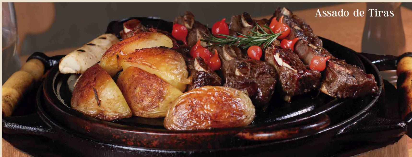
Assado de Tiras