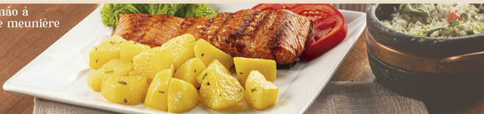
Salmão à belle meunière