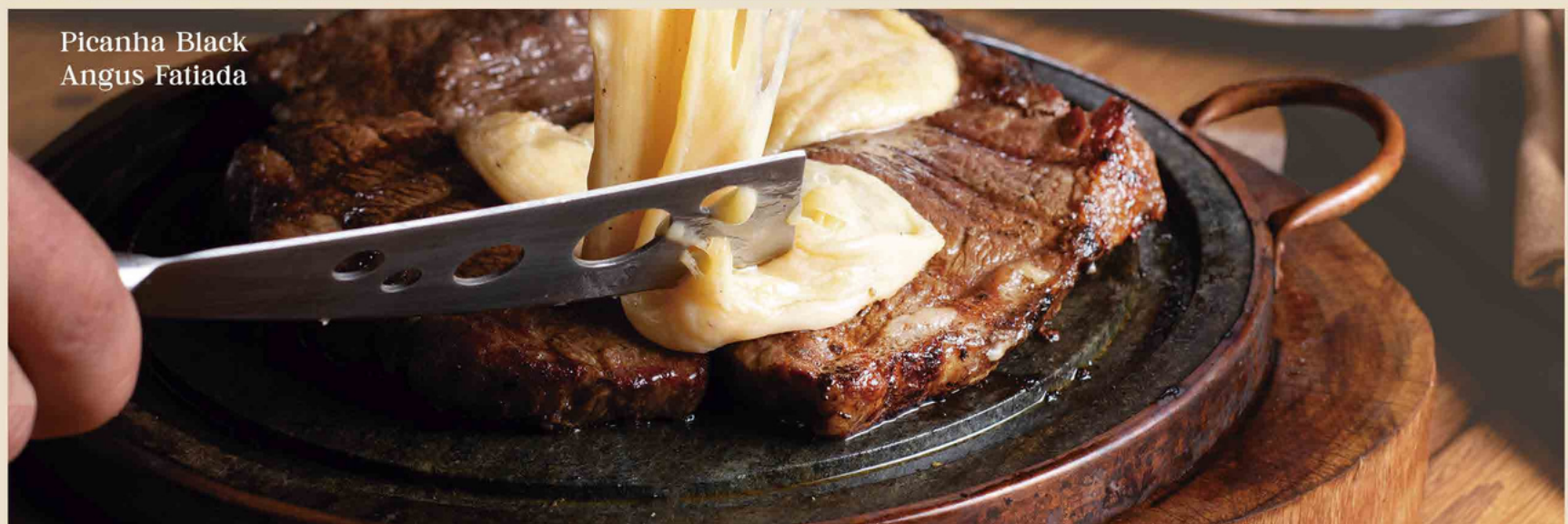
Picanha Black Angus Fatiada